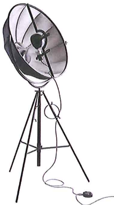
Die Stehleuchte Fortuny wurde 1907 von Mariano Fortuny entworfen und gilt als Designikone.

Die Marke Pallucco steht für eine Projektkultur, die auf experimentelle Weise Kunst, Architektur und Design miteinander verbindet. Für die Leuchten werden antike Verfahren, wie die Mundglasbläserei in Käfig, wiederentdeckt oder mit unterschiedlichen Verfahren und ästhetischen Möglichkeiten so lange experimentiert, bis eine einzigartige, zeitlose Leuchte entsteht.