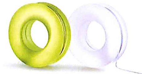
Rainy Day von Kazuhiro Yamanaka - Die Faszination der Endlosigkeit eines Rads.

Das Unternehmen Pallucco, das in den 1980er Jahren in Venetien gegründet wurde, ist auf die Herstellung dekorativer Leuchten spezialisiert und hat sich von Anfang an durch seine unkonventionellen Projekte und das nonkonformistische Image ausgezeichnet.